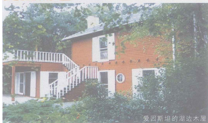
爱因斯坦的湖边木屋

今年是爱因斯坦的相对论诞生100周年，4月18日又是这位世界著名的物理学家逝世50周年纪念日。爱因斯坦在德国波茨坦附近小镇卡普斯居住过的夏季避暑小屋经修葺一新，对公众开放。