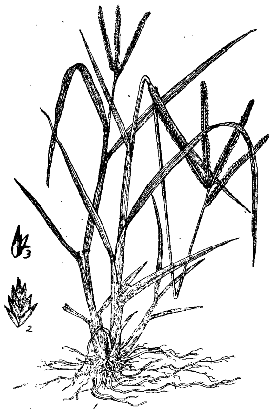
植物名：蟋蟀草 土名：牛頓草

以上二种不同的牛頓草，同样有防治乙型脑炎的作用。性味与功能亦大致相似。其不同点，习惯上牛頓草忌放糖，鼠尾牛頓草須要紅糖同煎。忌放糖和忌糖的原理何在，值得进一步的研究和探討，但在目前仍需按原来习惯使用。如果考虑品种有时可能弄錯，还是統一加些食盐为妥。